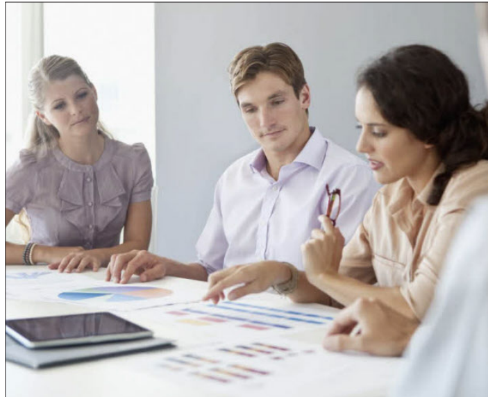
Die WIFI-Lehrgänge sind stets auf die aktuellen Anforderungen der Südtiroler Unternehmen zugeschnitten.

Die Anforderungen an Führungskräfte sind gestiegen. Gerade für junge Führungskräfte mit