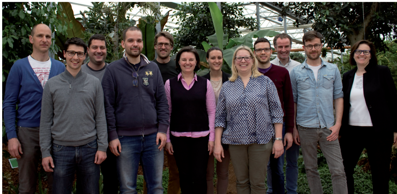
Abschlussveranstaltung in der Orchideenwelt Raffener in Gargazon.

Das WIFI, der Service für Weiterbildung und Personalentwicklung der Handelskammer Bozen , hat einen Praxislehrgang für junge Unternehmer/innen und Führungskräfte entwickelt. Nach erfolgreichem Abschluss der zweiten Ausgabe sind weitere Auflagen geplant.