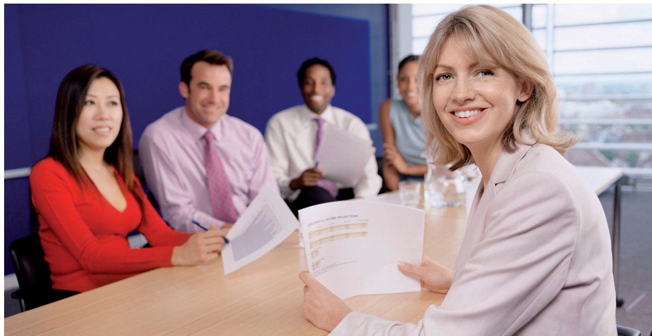
Diversity Management ist eine Chance für die Unternehmen.

Diversity Management bedeutet im unternehmerischen Kontext so viel wie „unternehmerische Vielfalt konstruktiv für den Unternehmenserfolg nutzen“. Es beinhaltet also Strategien des Personalmanagements zur Umwandlung der Vielfaltigkeit innerhalb eines Unternehmens in einen Wettbewerbsvorteil. Die Voraussetzung dafür ist, dass die Vielfalt erkannt, wertgeschätzt, und richtig gemanagt wird. Dann bringt sie einen Mehrwert für die Unternehmen und die Mitarbeiter und Mitarbeiterinnen. Resultate eines erfolgreichen Diversity Managements sind beispielsweise eine erhöhte Kreativität und Innovationsfähigkeit des Unternehmens. Außerdem lässt sich durch die Verschiedenheiten der Arbeitnehmer und Arbeitnehmerinnen ein breiteres Kundenspektrum ansprechen. Die Mitarbeiter und Mitarbeiterinnen von Unternehmen, die das Diversity Management gezielt anwenden, profitieren, indem sie voneinander lernen und Wertschätzung erfahren.