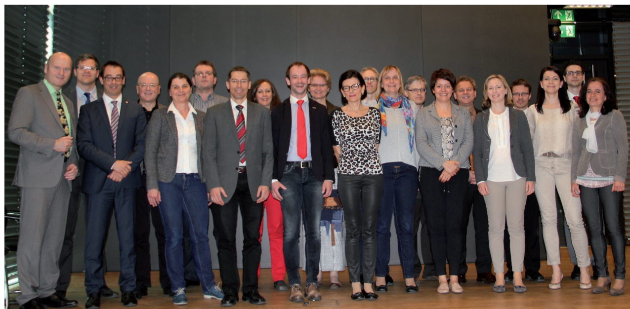
Die Abordnung aus Oberösterreich wurde in Bozen empfangen

Vergangene Woche, vom 23. bis zum 24. April, war eine 19-köpfige Delegation der Wirtschaftskammer Oberösterreich zu Besuch in der Handelskammer Bozen . Die Studienreise soll die Kooperation zwischen den zwei Kammern fördern und einen produktiven Gedankenaustausch bringen.