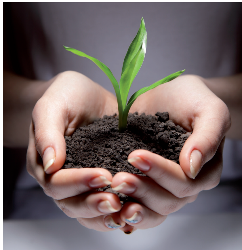
Die Aussichten auf Erfolg bei neu gegründeten Unternehmen steigen mit der Qualität der Beratung

Der Südtiroler Gründertag ist auch eine Informationsmesse. Alle für eine Firmengründung relevanten Institu-