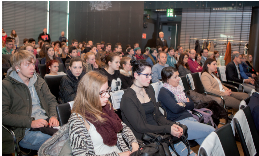
Zahlreiche Schüler/innen waren bei der Veranstaltung dabei.

Das WIFO – Institut für Wirtschaftsforschung der Handelskammer Bozen hat kürzlich gemeinsam mit der deutschen, ladinischen und italienischen Berufsbildung den 2. Wirtschaftstag für Berufsschüler/innen organisiert. Ehemalige Berufsschüler/innen erzählten von ihren Erfahrungen .