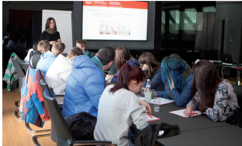
Verschiedene Workshops zu unterschiedlichen Themen fanden statt.

Bozen – Der Wirtschaftstag hatte das Ziel, mehr Bewusstsein für die Wertigkeit der Berufsbildung zu schaffen. Den Schüler/innen sollten positive Karrierebeispiele aufgezeigt werden, um ihnen zu vermitteln, dass sie mit Fleiß und Freude an der Arbeit beruflich viel erreichen können.